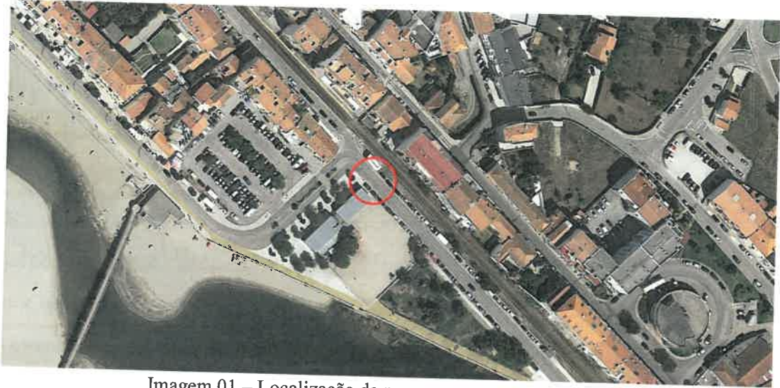
Imagem 01 – Localização da passagem para peões proposta